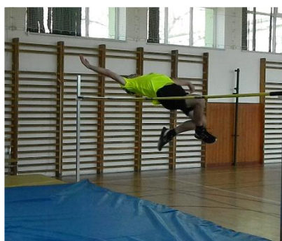
stojan pro skok vysoký