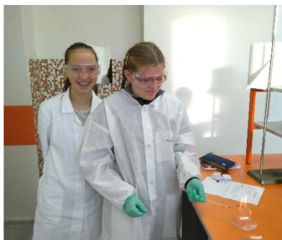
ochranné brýle a rukavice